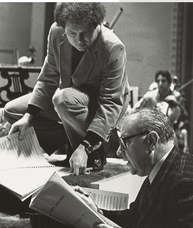
Conductor Yoel Levi and Ginastera in rehearsal with the Cleveland Orchestra (January 1981) / Director Yoel Levi y Ginastera en el ensayo con la Cleveland Orchestra (enero de 1981)

In this tranquil setting, Ginastera created a rich