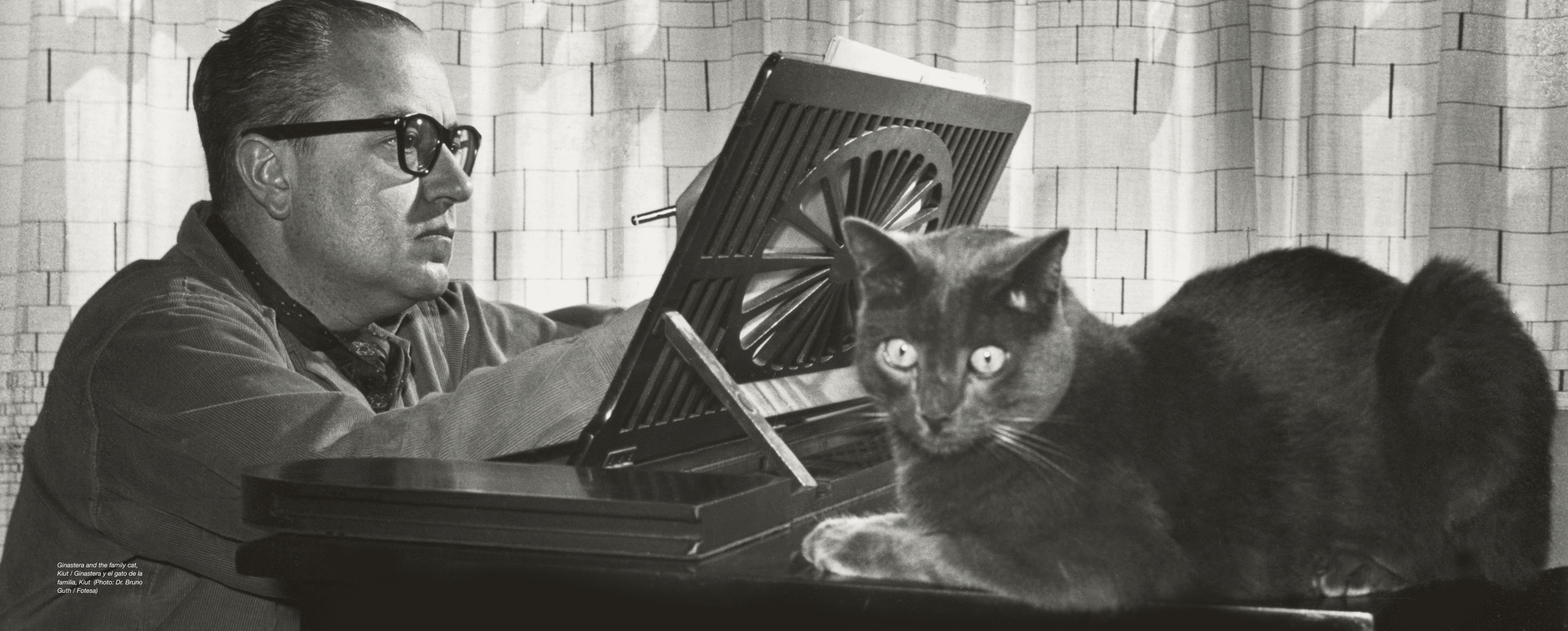
Ginastera and the family cat, Kiut / Ginastera y el gato de la familia, Kiut