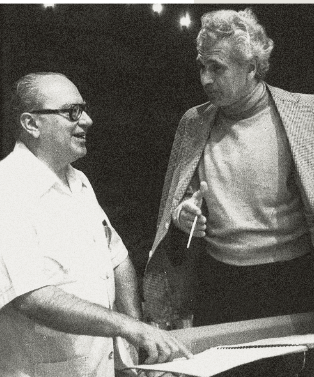
Ginastera and conductor Julius Rudel / Ginastera y el Maestro Julius Rudel

** Indicates a work with territorial restrictions (see disclaimer on pg. 33)