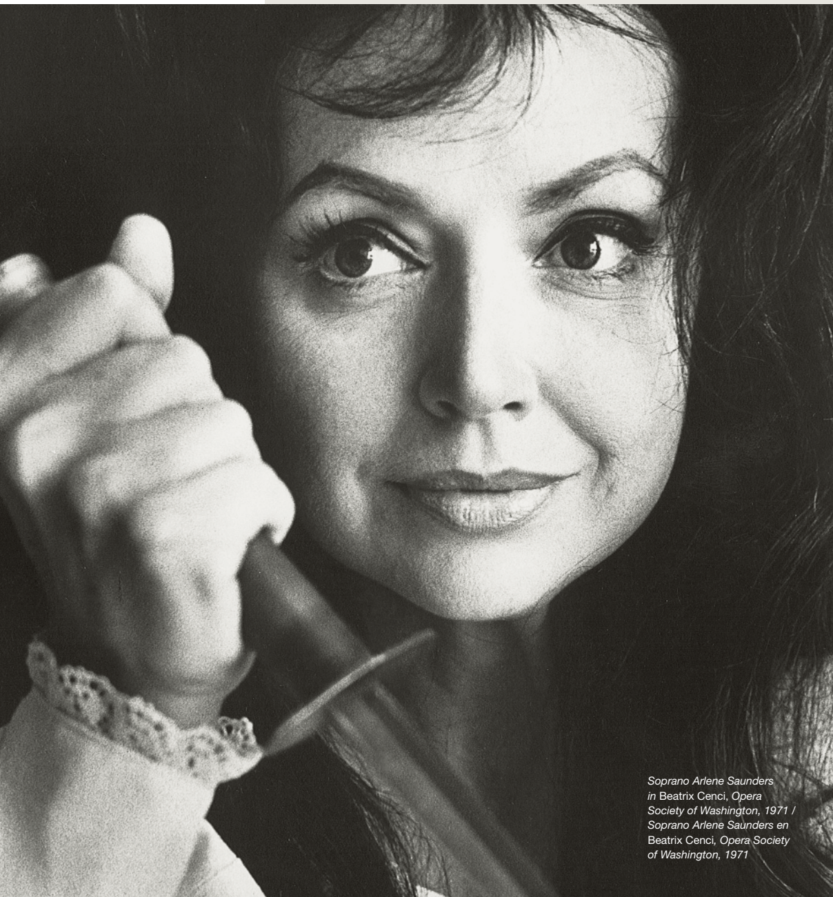
Soprano Arlene Saunders in Beatrix Cenci, Opera Society of Washington, 1971 / Soprano Arlene Saunders en Beatrix Cenci, Opera Society of Washington, 1971