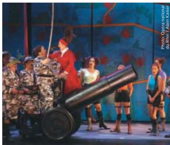
La Grande-Duchesse de Gérolstein an der Opéra national du Rhin, Regie François de Carpentries

„Quellenkunde und gute Laune vertragen sich bestens.“ Les Echos , 09.12.2003