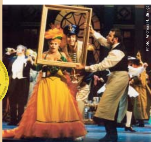
La Vie parisienne an der Oper Leipzig, Regie Jérôme Savary

„So merkwürdig es scheinen mag – dieses Pariser Leben , das wir alle zu kennen glaubten, mußte bis zur gegenwärtigen Neuausgabe warten, um so behandelt zu werden, wie es ihm zusteht: als ein Höhepunkt der Opéra-bouffe und ein Wunder an Fantasie. Alle früheren Aufführungen beriefen sich in Ermangelung einer überzeugenderen Grundlage auf eine angestaubte 'Tradition', von der Toscanini vor sechzig Jahren schon meinte, sie sei oft nur 'die verzerrte Erinnerung an die letzte schlechte Aufführung'. Zum ersten Mal bei diesem Werk konnte ich also mit einer echten Partitur arbeiten... Phrasierungen und dynamische Abstufungen haben von dieser entscheidenden Hilfe, welche ein exakter Notentext für den Interpreten bedeutet, zweifelsohne profitiert. So werden andere, differenziertere Farben möglich...“