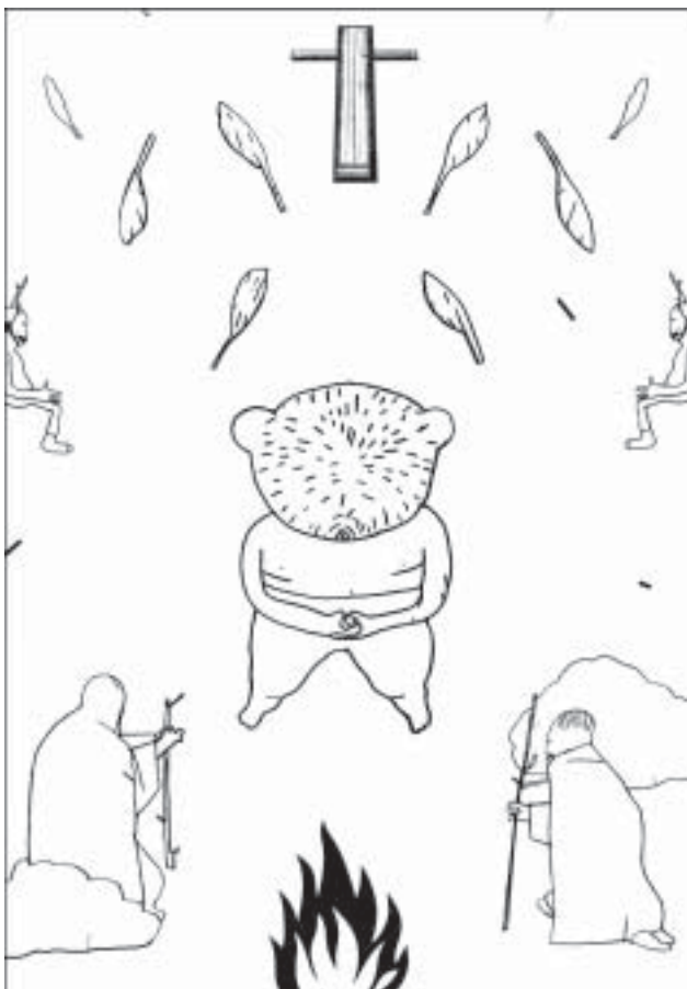
Graphik zu UNSICHTBAR LAND von Hagen Klennert www.hagenklennert.de © 2005

Gebärden könnte von Gebären kommen. Die älteste Sprache der einen Seite dieser Welt, die Mutter aller Sprachen, zusammen auf einer Bühne, in einem Raum mit der klingenden singenden Sprache der entgegengesetzten Seite dieser Welt.