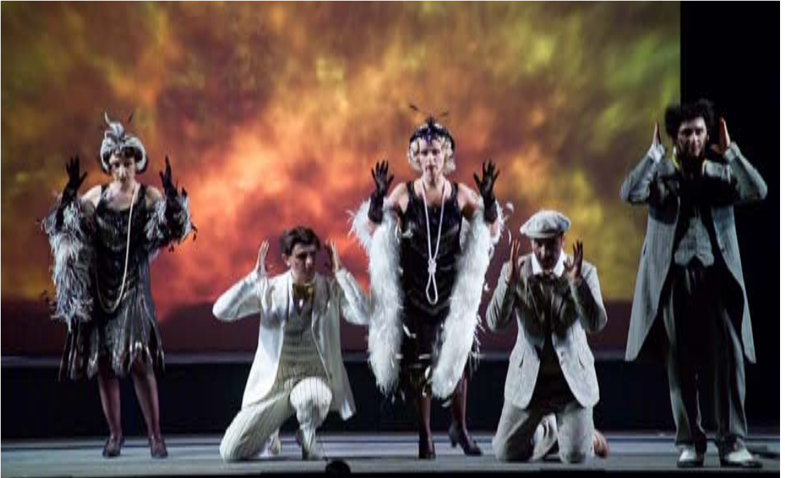
Lo sposo di tre e marito di nessuna: Davide Livermore's Erstaufführungsinszenierung der neuen kritischen Ausgabe für das Festival della Valle d'Itria (2005)