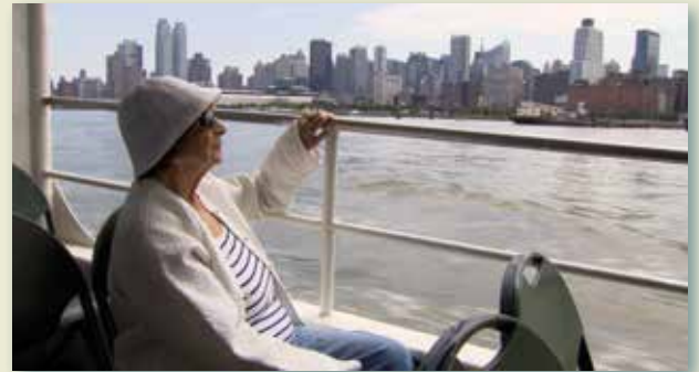
Ursula Mamlok in New York, 2012