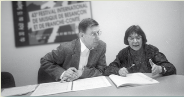
Herbert Blomstedt und Ursula Mamlok bei der Besprechung der Partitur von Constellations für die Uraufführung mit dem San Francisco Symphony Orchestra 1994.