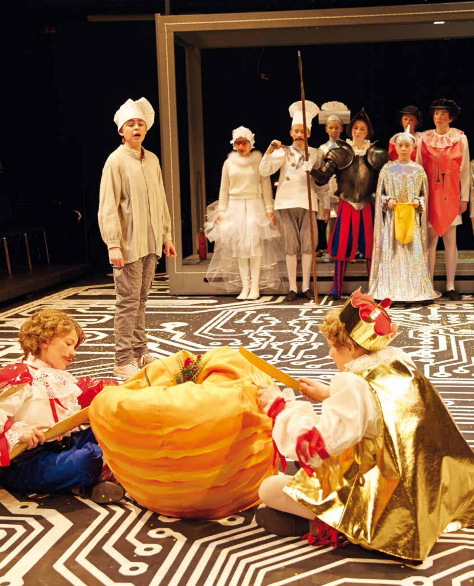
ZWERG NASE Hamburg, 2014 | mit Schülerinnen und Schülern aus Hamburger Schulen