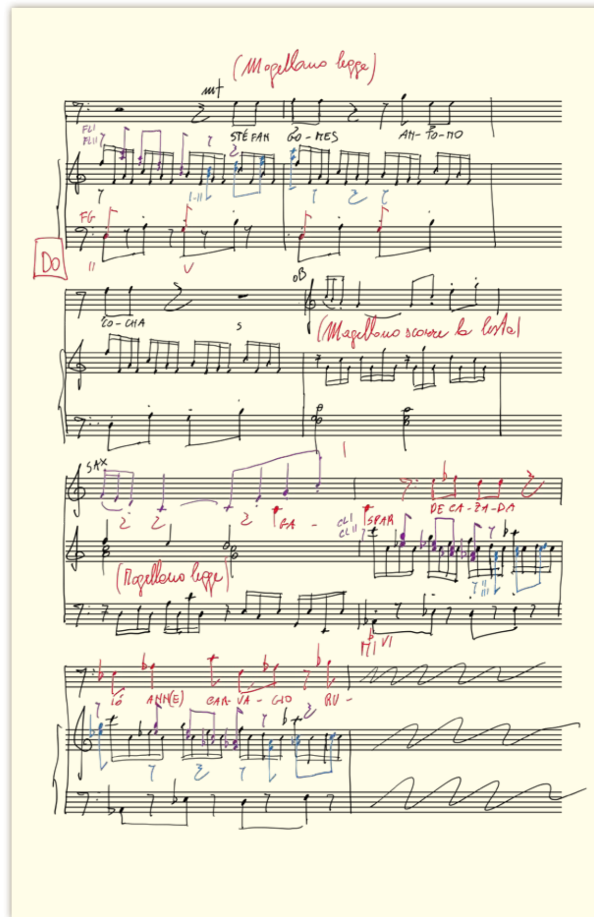
DIE ERSTE REISE UM DIE WELT | Kompositionsskizze von Pierangelo Valtinoni